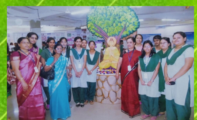
Exhibition at RDWU