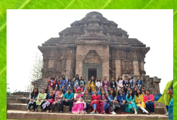
Visit to Konark